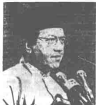
Datuk Seri Dr. Mahathir Mohamad