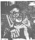
Prof. Diraja Ungku Aziz.